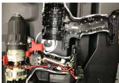
Zobrazení 6: BLACK EDITION akuvrtačka. Vysoce kvalitní, technicky bezchybné zpracování a komponenty.

Po extrémních zátěžových testech nebyly na vestavěných technických součástech ani u jednoho výrobce zjištěny závady ani známky opotřebení. V obou případech byla věnována velká péče technickým komponentům / kabeláži a zpracování uvnitř zařízení.