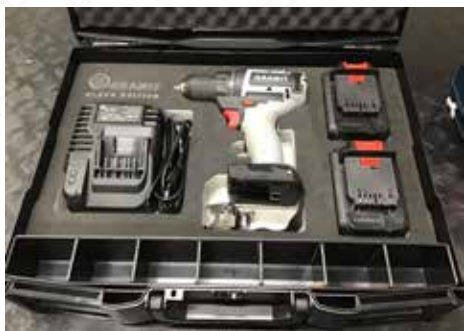
Zobrazení 2: Pěnová vložka. Precizní prohlubně, měkký plast a možnosti uložení různých doplňků s GRANIT BLACK EDITION.

Integrovaná pěna je velmi robustní a přitom pružná. Nástroje jsou tak bezpečně upevněny a chráněny. Navíc jsou do kufru integrovány jednotlivé přihrádky pro montážní příslušenství, jako jsou šrouby, bity a podobně.