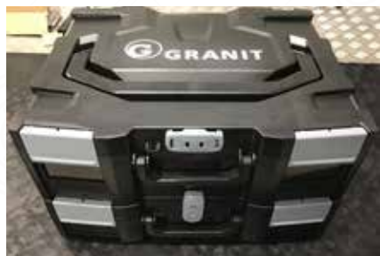
Zobrazení 1: 1X Systémový kufr GRANIT BLACK EDITION Přeprava několika kufřů.

Všechny systémové kufry řady GRANIT BLACK EDITION Power Tools lze stohovat. Tento princip stohování usnadňuje skladování a pomáhá při přepravě několika různých nástrojů současně.