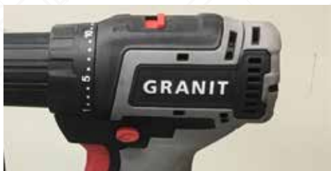
Zobrazení 4: Pohled na různé možnosti nastavení aku vrtačky Black Edition.

Aku vrtačka GRANIT BLACK EDITION dokázala zašroubovat 258 šroubů do dubového trámu na jedno nabití baterie.