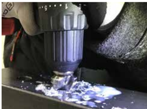
Zobrazení 5: Vrtací zkouška. Aku vrtačka Black Edition vyvrtala otvor o průměru až 26mm. Tržní konkurent vyvrtal průměr až 20 mm.

Během testovací série se ukázala výhoda dodatečné ochrany proti přehřátí pro aku vrtačku GRANIT BLACK EDITION. Tento integrovaný bezpečnostní prvek chrání vestavěnou elektroniku a mechaniku před přehřátím.